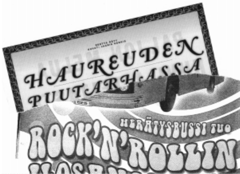
Helsingin Sanomien NYT-liite