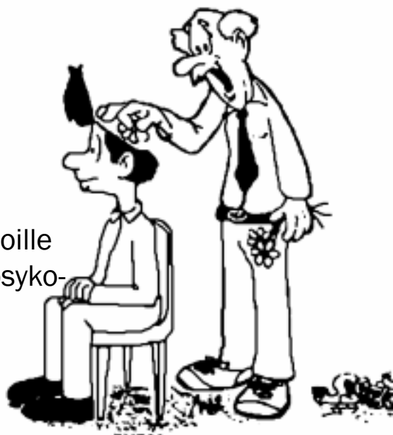
Piispa päättää vihkimyksestä

Piispainkokous päätti teologian opiskelijoille työharjoittelun jälkeen järjestettävästä psykologisesta soveltuvuustutkimuksesta.